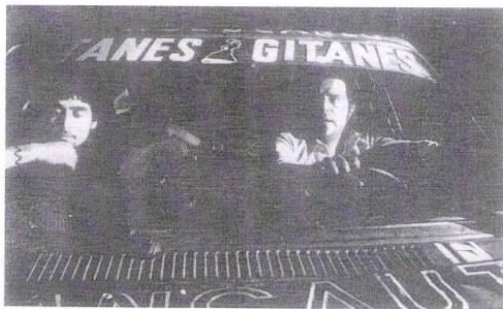
EL INCIDENTE DEL RALLY, ¿una teleportación?