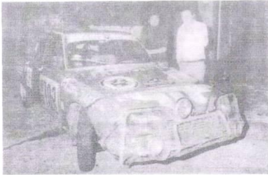
Moya y Acevedo junto al Citroen GS 1220 con que participaron del Rally.

2400 o alguno de los Mercedes Benz ), por lo que decidió disminuir sensiblemente la velocidad de su automóvil y pegarse al borde derecho de la cinta asfáltica a fin de facilitar el paso de lo que suponía era otro competidor del Rally.